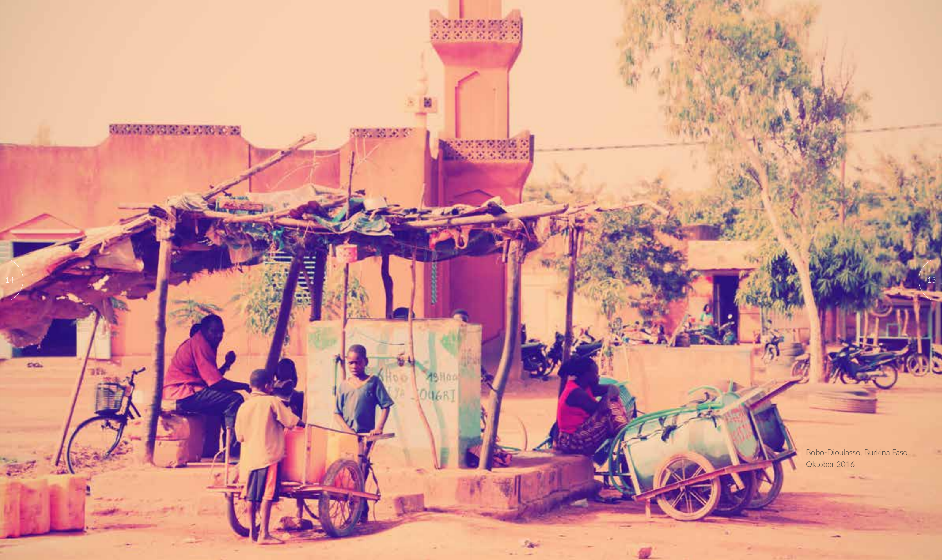
Bobo-Dioulasso, Burkina Faso Oktober 2016